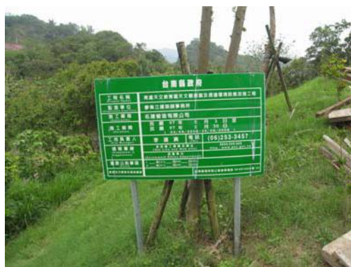
圖說：天文台之施工公告