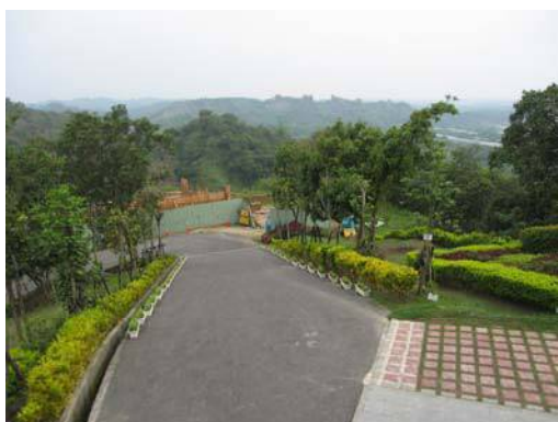
圖說：遺址所在地勢之高低落差大