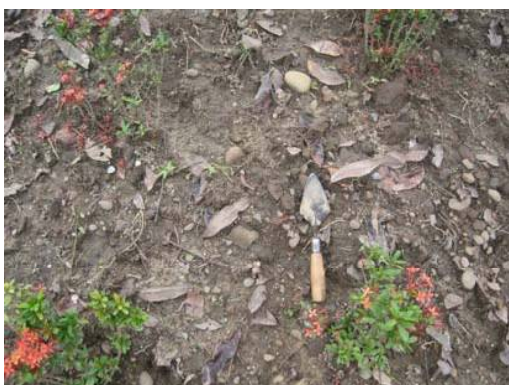
圖說：散於花園內的夾砂紅陶