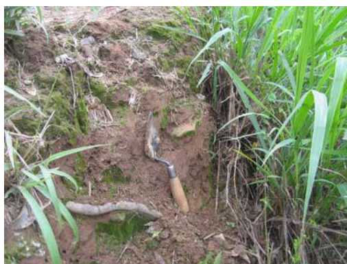
圖說：工地西側發現之夾砂陶片